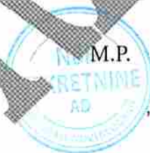
Predsednik Odbora Direktora „NBB NEKRETNINE“ AD, Beograd

Ova odluka stupa na snagu danom njenog donošenja.